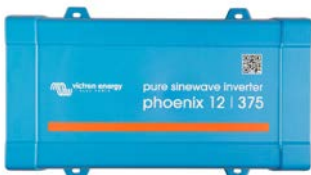
Phoenix 12/375 VE.Direct