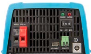
Phoenix 12/375 VE.Direct